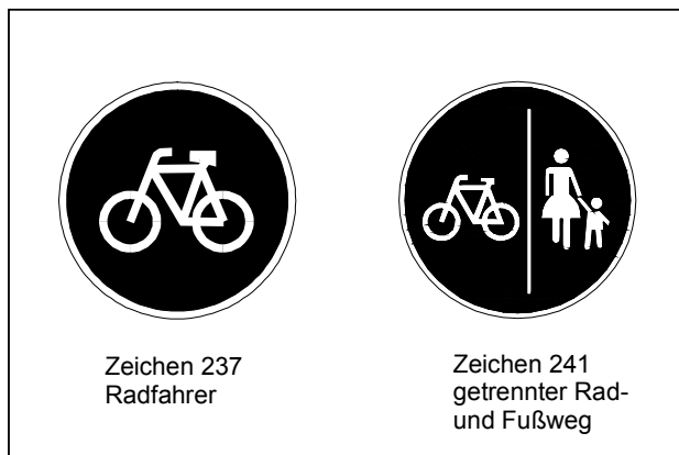
Abb. 7.1-1: StVO Zeichen 237 und 241

Einrichtungs- und Zweirichtungsradwege , die durch die StVO Zeichen 237 oder 241 beschildert sind (vgl. Abbildung 7.1-1 ). Auf diesen Wegen, die 2,00 Meter, mindestens aber 1,50 Meter breit sein sollen, besteht für den Radfahrer in der Regel Benutzungspflicht, wobei auch Einzelfallentscheidungen möglich sind.