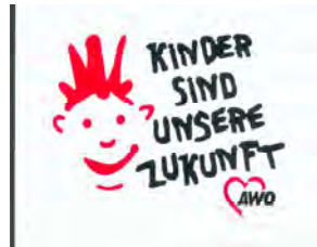
Familienzentrum der Arbeiterwohlfahrt Ruth Grohe Haus