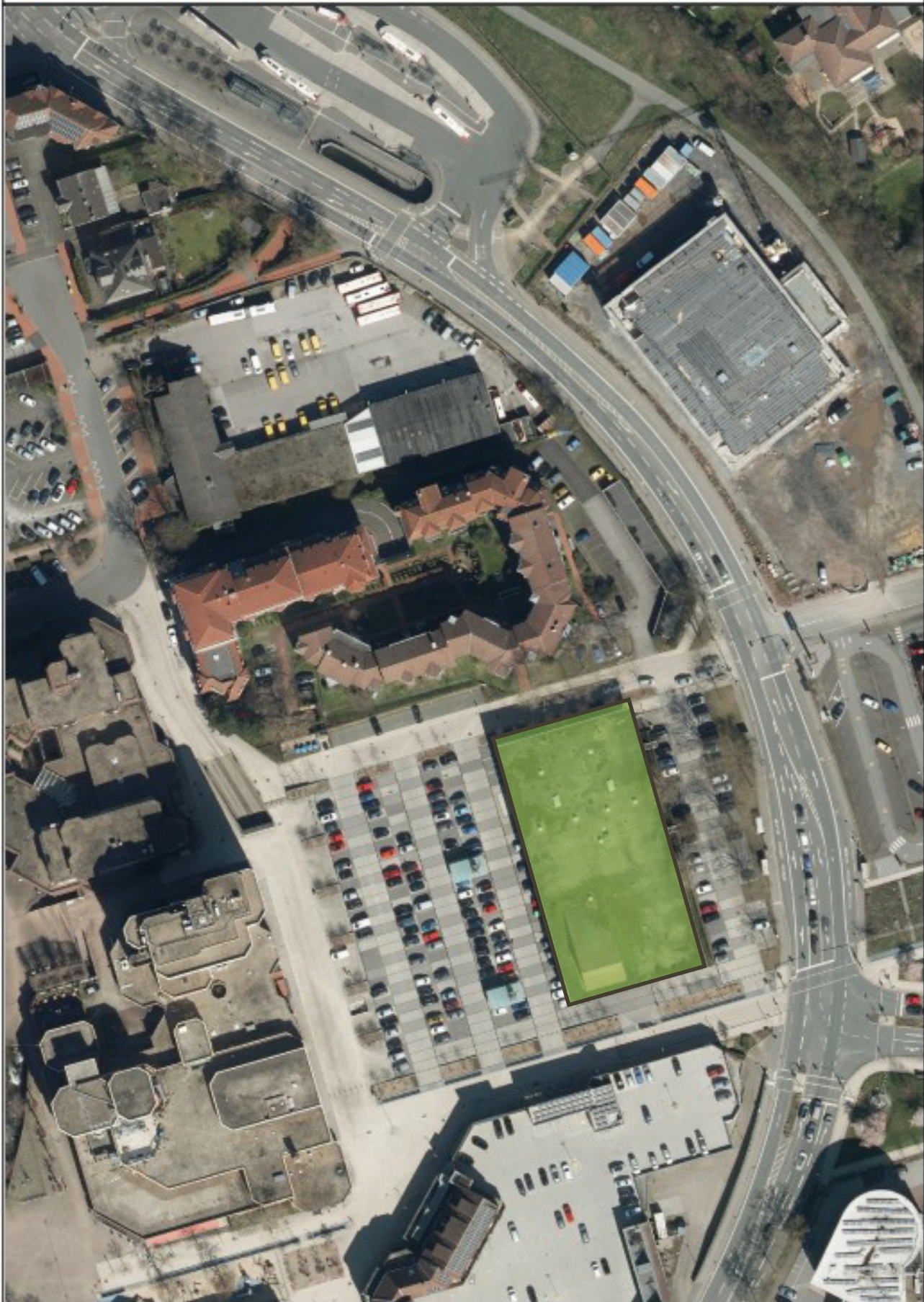
Anlage 2: Auszug Geodatenportal