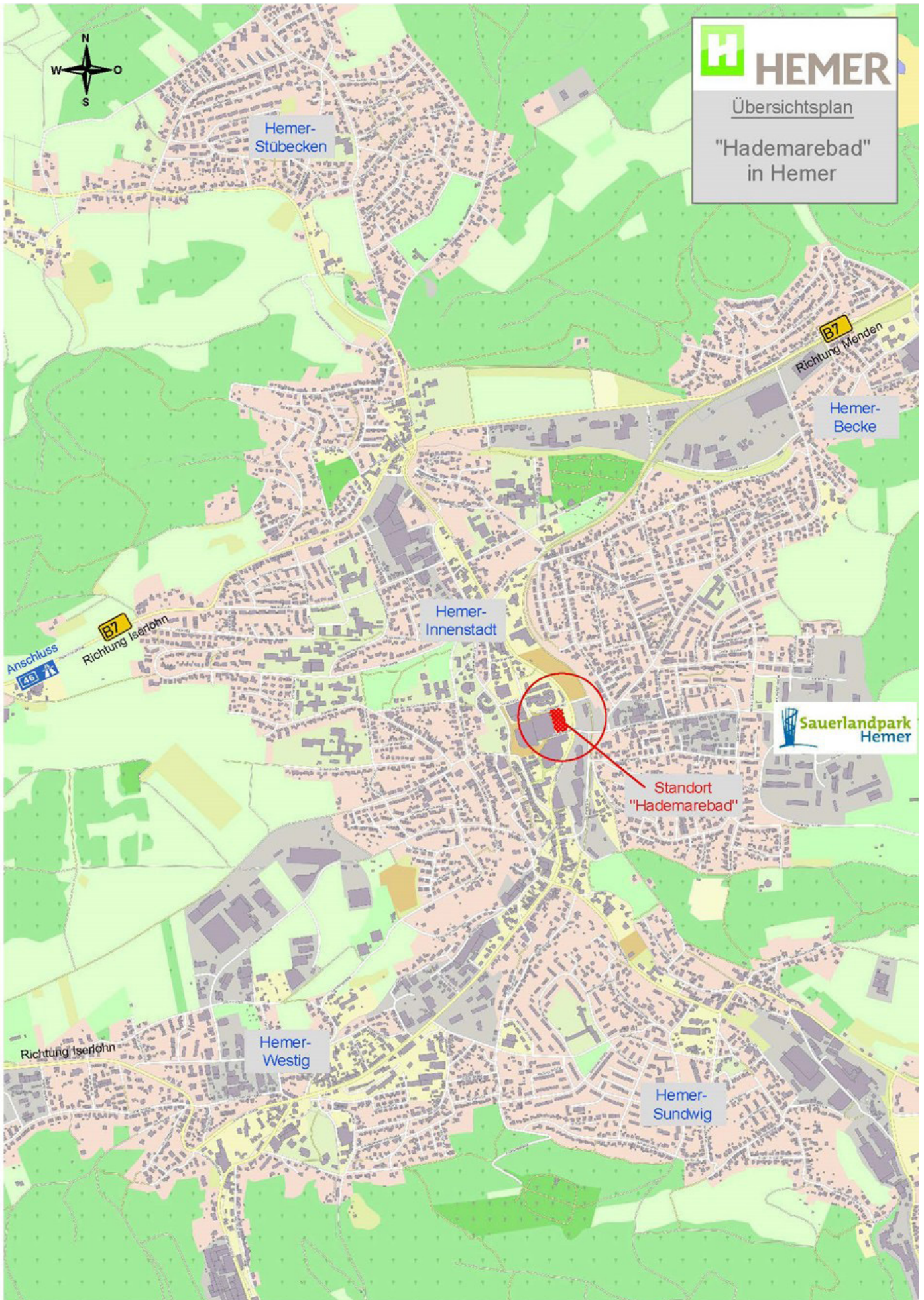
Anlage 3: Auszug Stadtplan (Quelle Stadt Hemer)